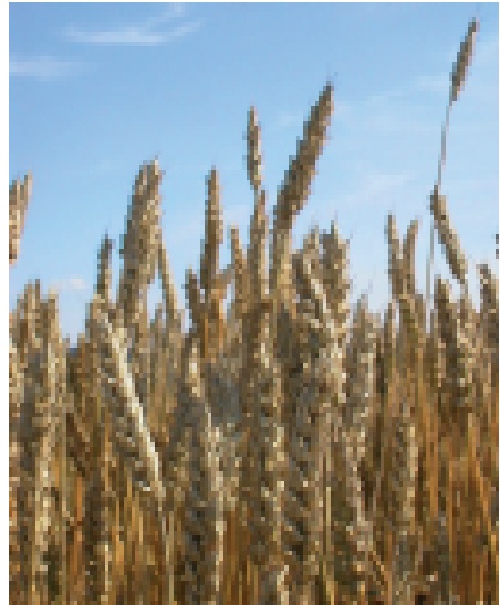
Immer mehr Getreide und Hülsenfrüchte werden an Schlachttiere verfüttert.