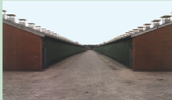
Tierfabriken sind nur auf den ersten Blick platzsparend: Für den Futtermittelanbau werden enorme Flächen benötigt.

Auf der Fläche eines Grundstückes, die benötigt wird, um ein Kilo Fleisch zu erzeugen, könnte man im selben Zeit-